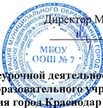
Таблица-сетка часов плана внеурочной деятельности муниципального бюджетного общеобразовательного учреждения муниципального образования город Краснодар основной общеобразовательной школы № 7 имени Евдокии Давыдовны Бершанской для 2 классов, реализующих федеральный государственный образовательный стандарт начального общего образования в 2020-2021 учебном году