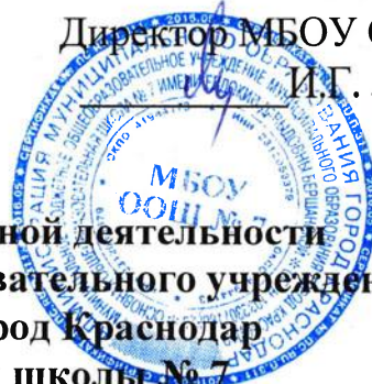
Таблица-сетка часов плана внеурочной деятельности муниципального бюджетного общеобразовательного учреждения муниципального образования город Краснодар основной общеобразовательной школы № 7 имени Евдокии Давыдовны Бершанской для 7 классов, реализующих федеральный государственный образовательный стандарт основного общего образования в 2020-2021 учебном году