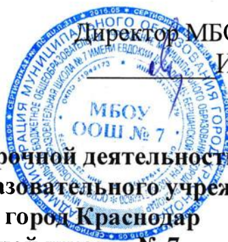
Таблица-сетка часов плана внеурочной деятельности муниципального бюджетного общеобразовательного учреждения муниципального образования города Краснодар основной общеобразовательной школы № 7 имени Евдокии Давыдовны Бершанской для 6 классов, реализующих федеральный государственный образовательный стандарт основного общего образования в 2020-2021 учебном году