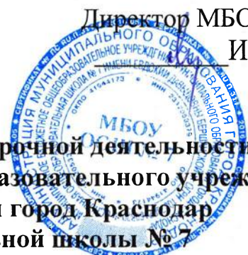
Таблица-сетка часов плана внеурочной деятельности муниципального бюджетного общеобразовательного учреждения муниципального образования город Краснодар основной общеобразовательной школы № 7 имени Евдокии Давыдовны Бершанской