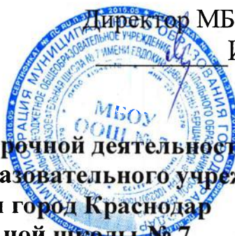
Таблица-сетка часов плана внеурочной деятельности муниципального бюджетного общеобразовательного учреждения муниципального образования город Краснодар основной общеобразовательной школы № 7

Утверждаю Директор МБОУ ООШ №7 И.Г. Левицкая