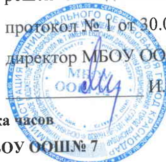
Таблица-сетка часов учебного плана МБОУ ООШ № 7 для 9 А, Б классов, реализующих ФГОС ООО на 2018 – 2019 учебный год