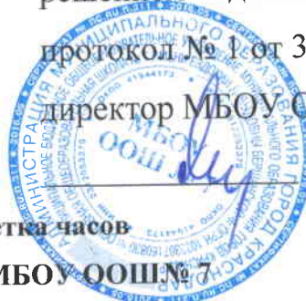
Таблица-сетка часов учебного плана МБОУ ООШ № 7 для 6 А, К классов, реализующих ФГОС ООО на 2018 – 2019 учебный год